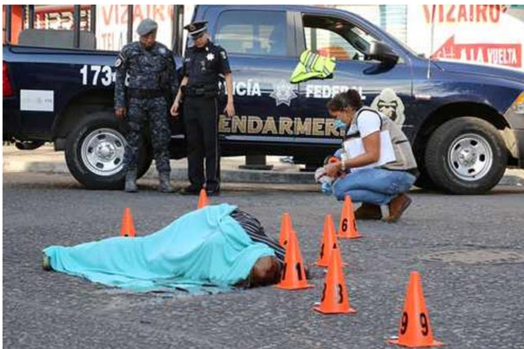
Figura 1. En el Puerto de Acapulco han ocurrido choques entre grupos armados, pese a la presencia de fuerzas federales. Foto: Javier Verdín. Periódico La Jornada, domingo 22 de marzo de 2015, p. 2.

requiere intervención mundial para parar esta destrucción. Sin embargo, en México se vende una idea construida de que este combate llevará a la pacificación de todo el territorio. De esta manera se vislumbra un aumento en el número de fallecimientos relacionados a la privación de la vida, generando un panorama local y uno general. El primero se analiza como conflictos de territorio por grupos de poder o alianzas entre grupos rivales; el segundo como una acción esporádica entre grupos de poder que están inconformes con su parte territorial. Con ello se fragmenta la violencia como parte final de combate al establecimiento de la legalidad por parte del Estado. Así, lo que se puede observar en gran parte de la república mexicana son imágenes cargadas de la destrucción de la vida humana. Éstas se contraponen a las imágenes fragmentadas por el eje fáctico, vendidas como esporádicas y fuera de lugar (Figuras 1 y 2).