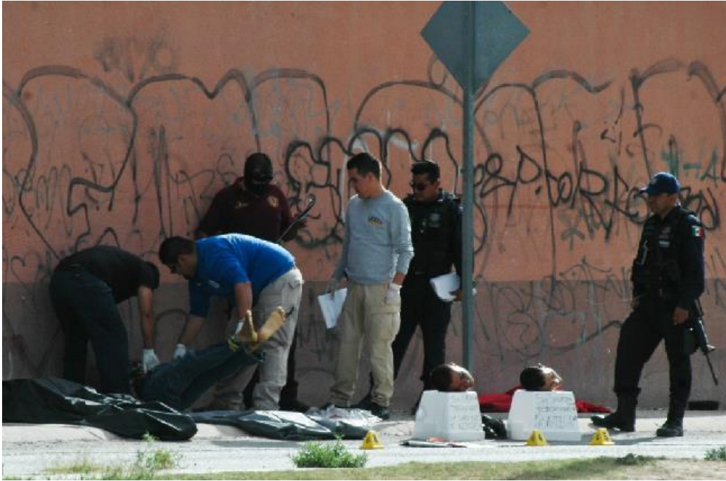
Figura 2. Violencia y fotografía. Publicar o no, he ahí el dilema. Revista Cuartooscuro, Agencia de Fotografía y Edición. Carlos María Meza y Anasella Acosta, 10 de febrero del 2011.

Cabe mencionar que esta violencia está focalizada en ciertas zonas del país como Guerrero, Baja California Norte, Chihuahua, Sinaloa, Durango y Nayarit [27]. Sin embargo, no se pueden aislar de las condiciones generales del país sin perder un enfoque holístico y crítico. Este análisis no debe decidirse exclusivamente con los números brutos en los que se basa el Estado. Debe existir una transformación hacia valores relativos, donde la posibilidad de 100 muertos en un lado contra 10 en otro no deslinda el hecho de la existencia de un ente malévolo mayor de un lado u otro del país. Todo esto corresponde a un mismo fenómeno de conclusión fatal, donde el análisis del homicidio es parte fundamental del desenlace global de una ineptitud de los sistemas que imparten justicia.